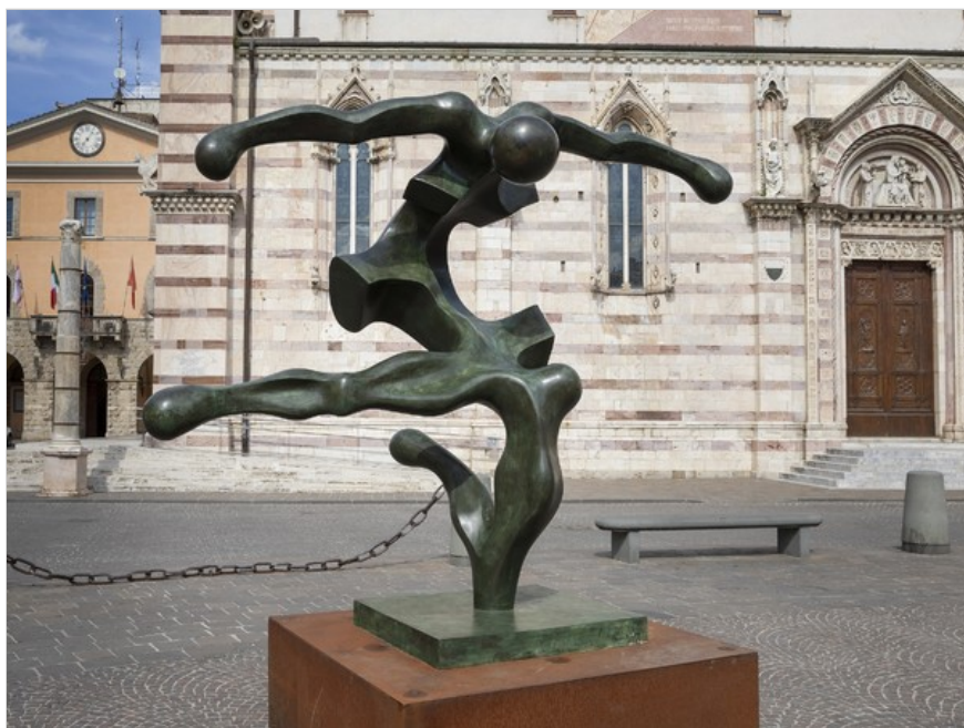
Sauro Cavallini, Icaro, 1983, bronzo, cm. 200x220